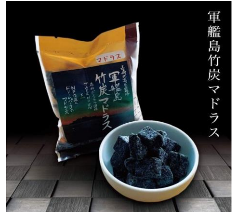
軍艦島竹炭マドラス