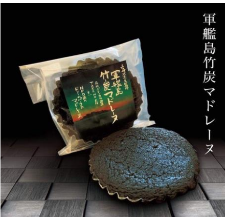
軍艦島竹炭マドレーヌ