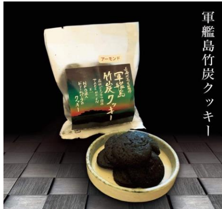
軍艦島竹炭クッキー